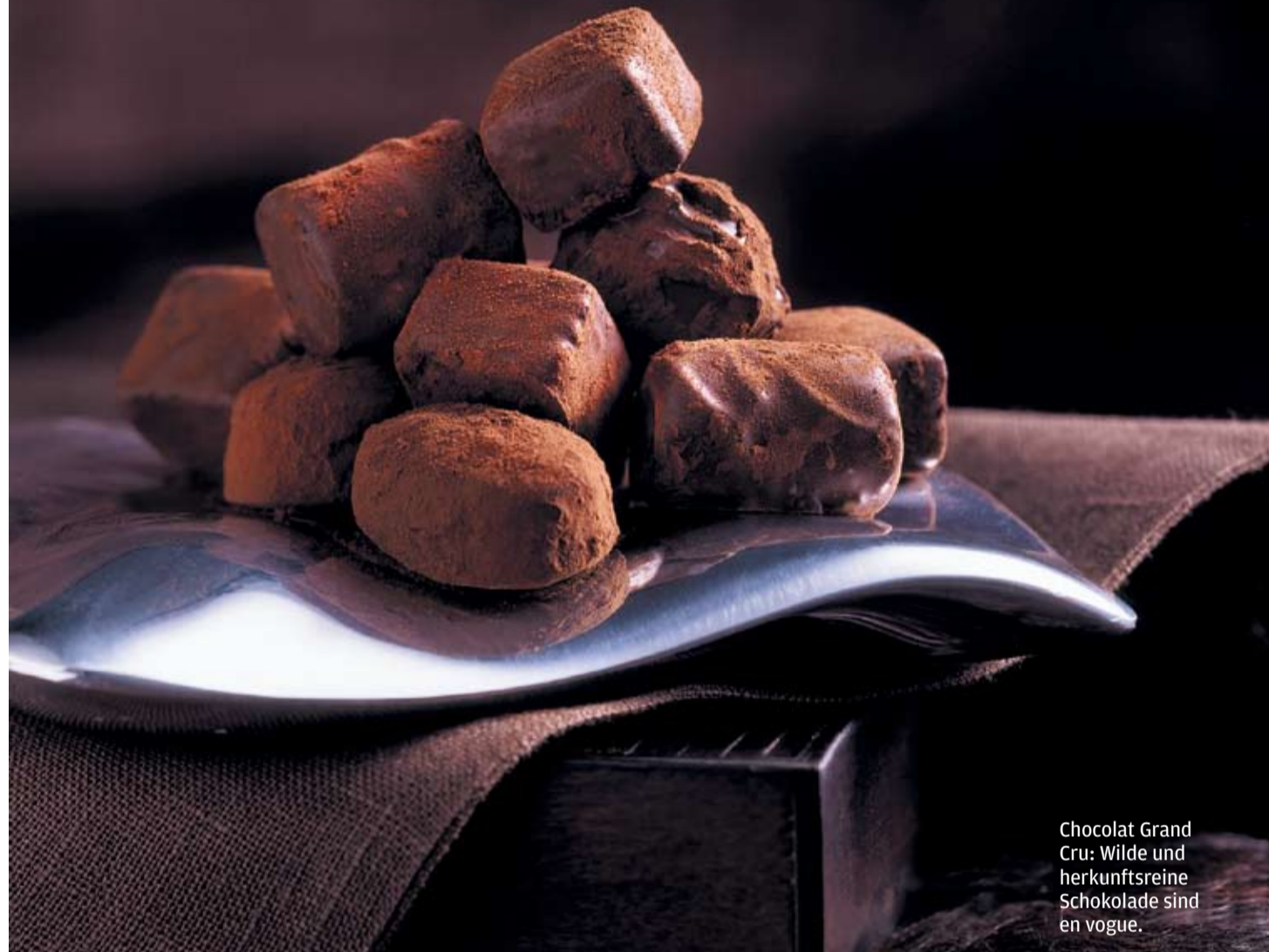
Chocolat Grand Cru: Wilde und herkunftreine Schokolade sind en vogue.

assortiert mit Orangenstücken, Florentiner Füllung oder wie in der neuesten «Collection de Truffles Grand Cru» mit Single Malt Whisky, Mocca oder dunklem Rum, öffnet sich dem Connoisseur eine weit gefächerte Palette, durch die das Können des traditionellen Schokoladen-Handwerks schimmert.